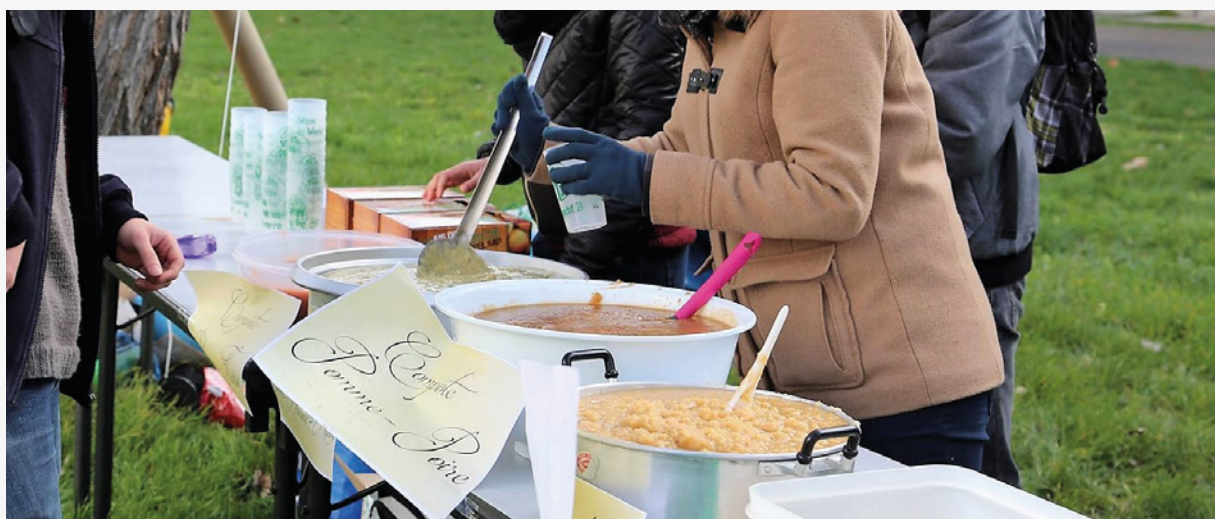
Food Rescue Party organisée par Objectif 21.

Les Food Rescue Parties sont inspirées des "Disco Soupes" . Le but c'est de sensibiliser au gaspillage alimentaire en montrant qu'il est possible de cuisiner avec des produits prêts à être jetés. De plus, cela nous permet de proposer un repas gratuit et solidaire aux étudiant·e·s, et souvent d'inclure l'événement dans une journée liée au développement durable.