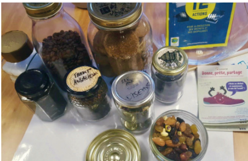
Pots de matières premières de l'association pour le goûter au début du film La vague citoyenne.

Les participant-e-s sont souvent surpris à première vue mais n'émettent pas d'avis négatifs : ils sont plutôt curieux et posent des questions sur notre démarche. Beaucoup repartent avec des idées de recettes à reproduire chez eux. Nous gagnons donc aussi le pari de la sensibilisation !