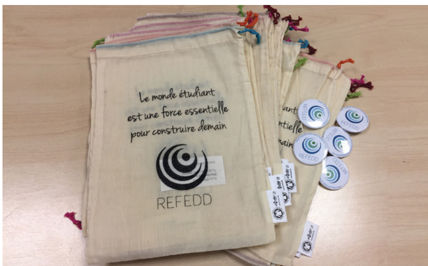
Sacs à vrac