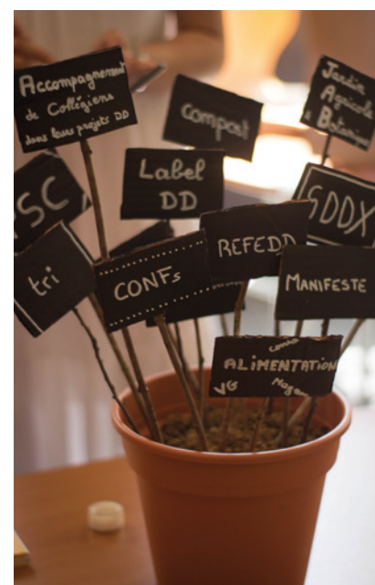
Les RENEDD 2016, Événement éco-responsable à la CIUP.

En effet, s'engager dans une démarche d'écoresponsabilisation de ses événements, ce n'est pas toujours simple. Il faut souvent affronter des camarades hostiles, qui ne voient pas l'intérêt mais en mesurent les coûts. Pourtant, vous avez tout à gagner à responsabiliser vos événements ! Après quelques précisions sur les intérêts et les piliers d'un événement éco-responsable, ce guide vous présentera les différents domaines dans lesquels vous pouvez intervenir, ainsi que des idées de projets et des retours d'expériences. Transports, alimentation, communication, déchets... la marge de manoeuvre est grande. N'hésitez pas à recommander et prêter ce guide aux autres associations présentes sur votre campus pour répandre la vague de l'écoresponsabilité !