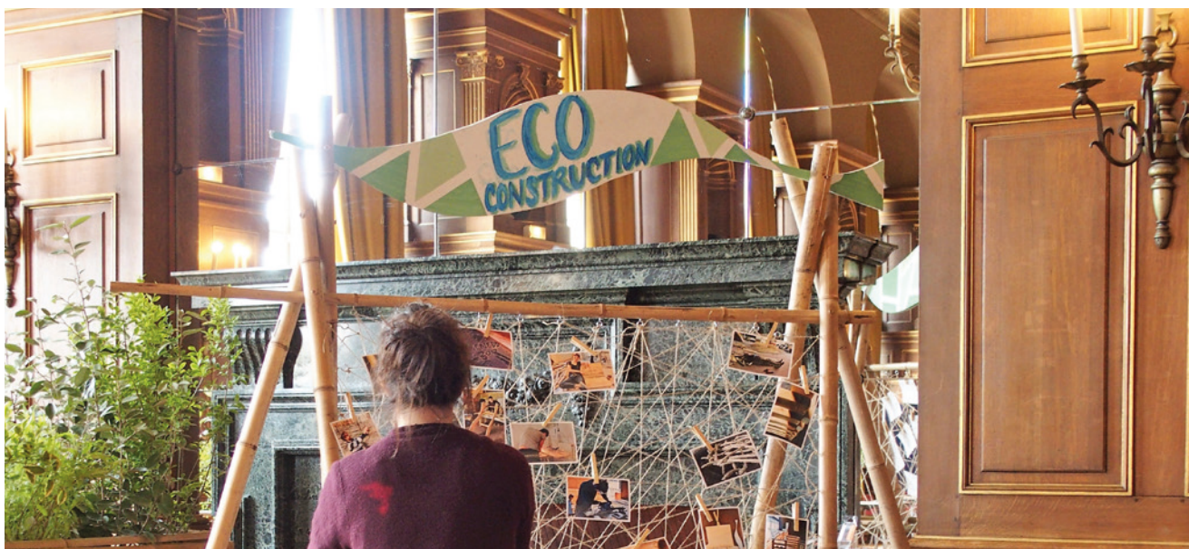
Eco construction pour les 10 ans des RENEDD.