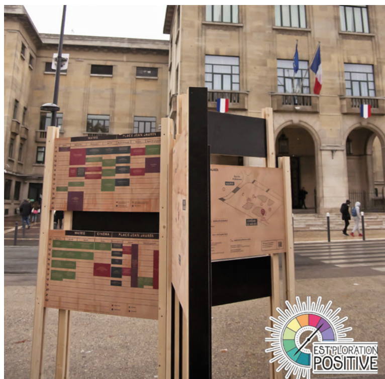
Signalétiques en bois du salon Est'ploration positive.