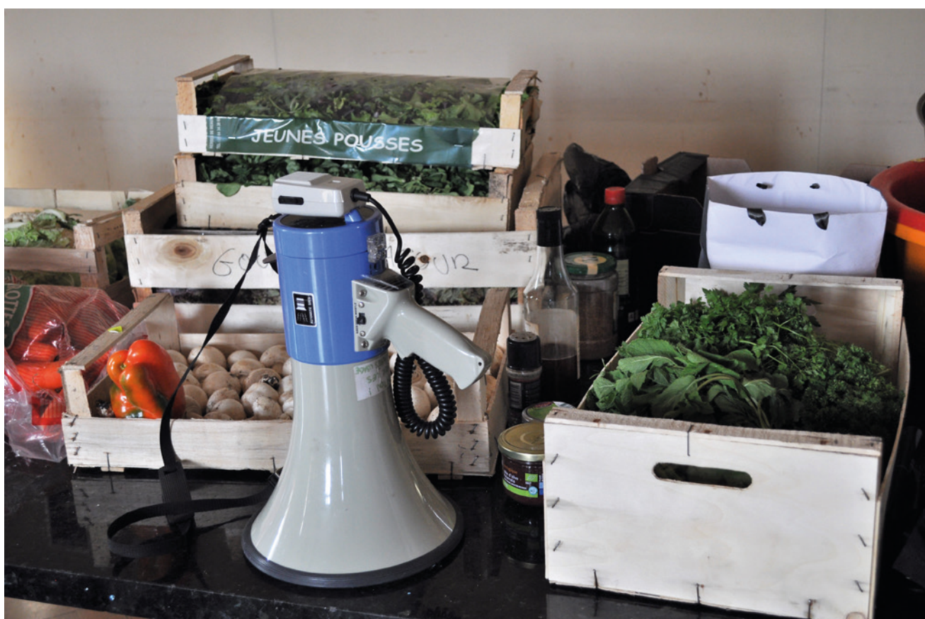
Fruits et légumes invendus récupérés pour la disco-soupe aux RENEDD 2017.

✓ Un point d'attention sur la vision du développement durable que l'on doit prendre en compte : un événement éco-responsable s'engage non-seulement dans une démarche écologique mais également sociale, il doit être le plus inclusif possible !