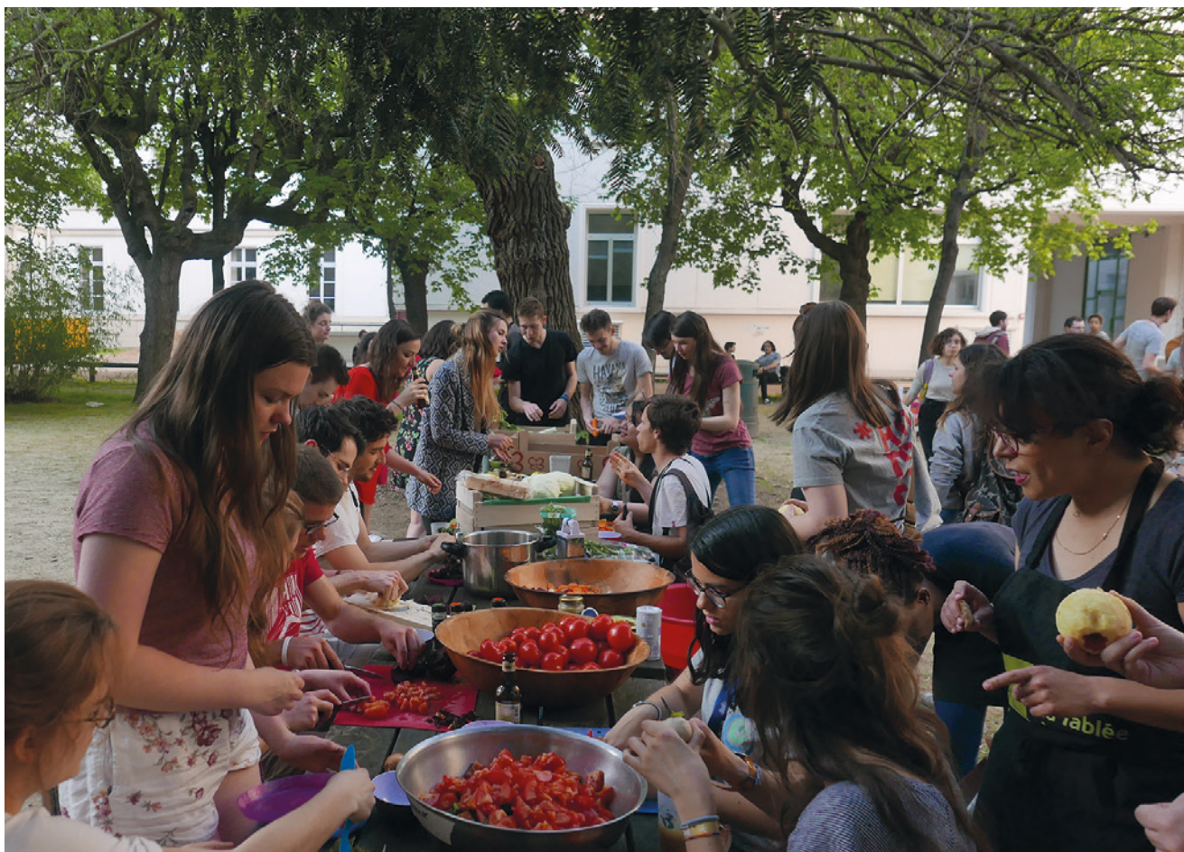
Disco-soupe aux RENEDD 2018.

Nous essayons de faire au moins une ou deux Food Rescue Parties dans l'année avec l'association. Le fonctionnement est plutôt bon, nous avons juste à résoudre des petits problèmes de temps à autres. Nous souhaitons revoir quelques aspects tout de même, comme le côté sensibilisation puisque les personnes ont tendance à juste profiter de la nourriture gratuite sans vraiment se renseigner ! Sinon, nous le conseillons à toutes les associations motivées car c'est un super projet, notamment au niveau de la cohésion au sein même de l'association.