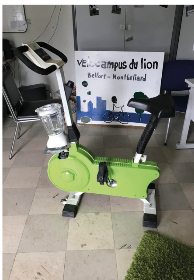
Vélo-smoothie construit pour Vélocampus du Lion.

lames. J'ai rallongé le tout et mis une roulette de meuble achetée elle aussi. Attention, il faut bien regarder le sens de rotation lorsque l'on ajuste la roulette à la roue. J'ai ensuite soudé le socle du mixeur sur le socle accroché au vélo pour que le tout tienne bien. Le principe est simple et marche comme une lumière dynamo. Quand tu pédales, la roue du vélo tourne et actionne la petite roulette qui elle entraîne les lames du mixeur. Pour finir, j'ai peint l'ensemble en blanc et vert et décoré par la suite.