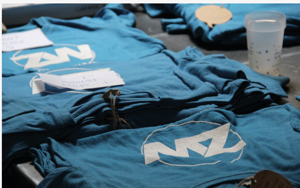
Tee-shirt éco-conçu Zero Waste France.

Nous avons déjà essayé sur un précédent projet de teindre et floquer nous-même des tee-shirts récupérés, pour pousser au maximum notre démarche zéro déchet. Honnêtement, nous vous le déconseillons : il nous aurait sans doute fallu des lots de tee-shirts identiques, car le résultat ne rendait pas bien. Nous avons donc décidé de passer par un prestataire pour le festival.