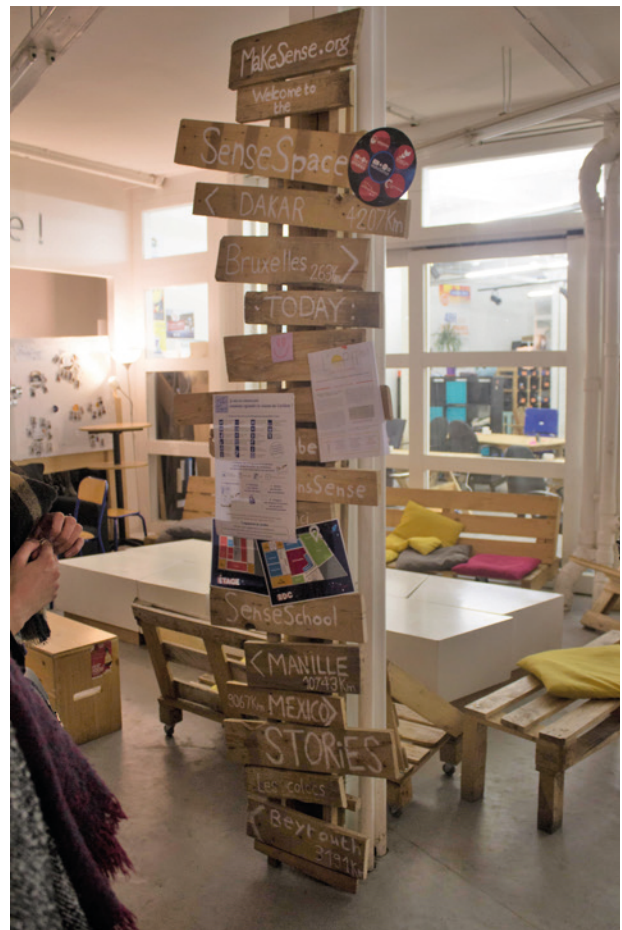
Signalétiques faites main RENEDD 2017.