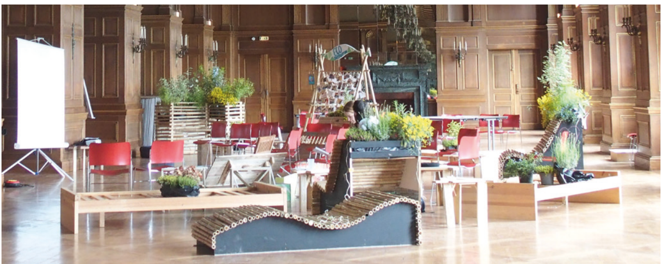
Scénographie mise en place RENEDD 2016.

Tous les éléments de scénographie ont donc été construits dans le but de promouvoir la récupération de matériaux et leur réemploi, l'utilisation de produits écologiques ou non-toxiques, la récupération des outils de construction plutôt que l'achat ; seuls les consommables ont ainsi dû être achetés. Les éco-constructions ont également été réfléchies dans une optique d'alternative à l'utilisation unique du mobilier événementiel (afin d'éviter les déchets suite à l'événement), et ont donc été prévues pour des utilisations multiples, pour des espaces de différentes tailles et avec une optimisation par système de modules pour faciliter le transport.