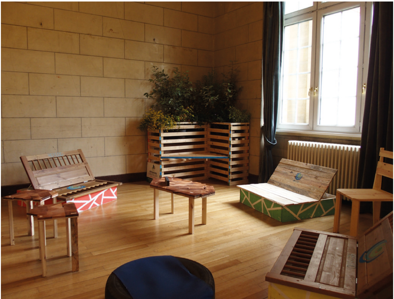
Scénographie éco-responsable faite main aux REncontres Nationales Etudiantes du Développement Durable 2017.

Dans ce guide, nous avons voulu regrouper un ensemble d'actions simples à réaliser pour éco-responsabiliser son événement et sensibiliser les participant·e·s, étudiant·e·s ou non, à cette problématique.