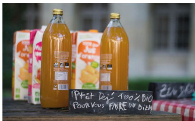
Petit déjeuner 100 % Bio à la Cité Internationale Universitaire de Paris en octobre 2016.

Lorsque l'on organise des événements de sensibilisation au développement durable et que l'on prévoit une collation ou un repas, il est primordial de rester en phase avec les valeurs que l'on diffuse. Proposer quelque chose d'éthique, de durable et de responsable n'est pas si compliqué. Le but est que votre collation reflète l'image de l'événement et que les participant·e·s en garde une bonne impression !