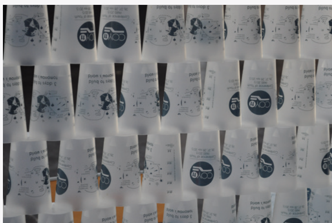
Ecocups de la COY11 au 10 ème RENEDD.

L'association propose le prêt de gobelets pour n'importe quelle occasion : ces gobelets sont réutilisables et sont alloués en échange d'une caution, rendue lorsque l'association partenaire restitue le matériel prêté. Nous en avons acheté 150 environ. Les associations qui souhaitent les emprunter doivent signer une attestation de prêt, laisser une caution d'1€ par verre et s'engager également à les rapporter propres, secs et en bon état. La caution est gardée pour les gobelets manquants ou cassés.