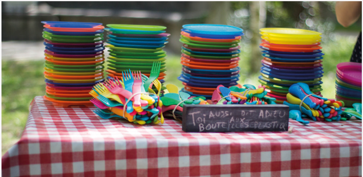
Vaisselle prêtée par l'association Animafac pour les RENEDD 2017.

Vous pouvez profiter de ce biais pour sensibiliser les associations à d'autres éco-gestes à introduire sur leurs événements, notamment au niveau du tri. Si vous prêtez du matériel plus précieux type scénographie ou matériel technique, n'hésitez pas à faire une petite formation aux emprunteurs ou du moins à leur confier un guide d'utilisation pour retrouver votre matériel en bon état.